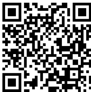
Z Bulandą po Lubomierzu