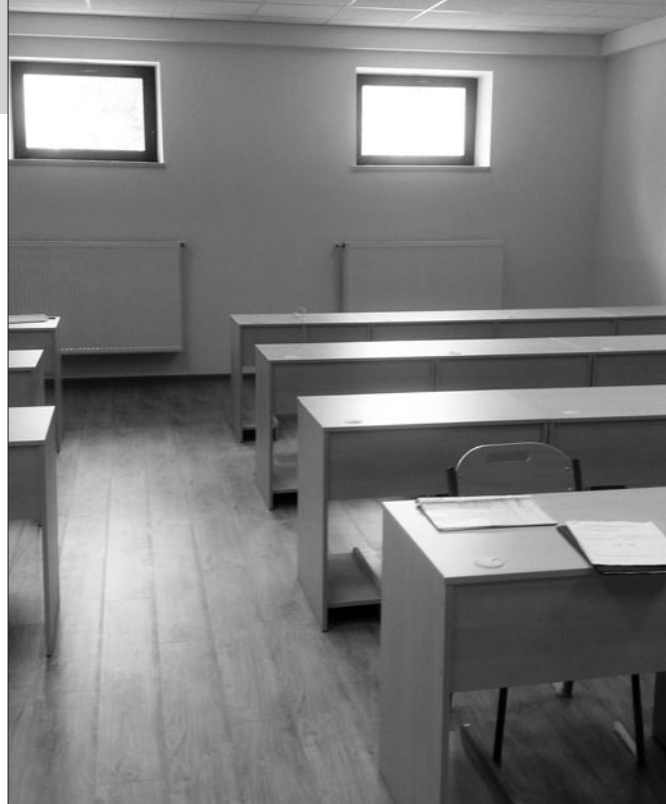
Sala komputerowa w szkole w Łętowem