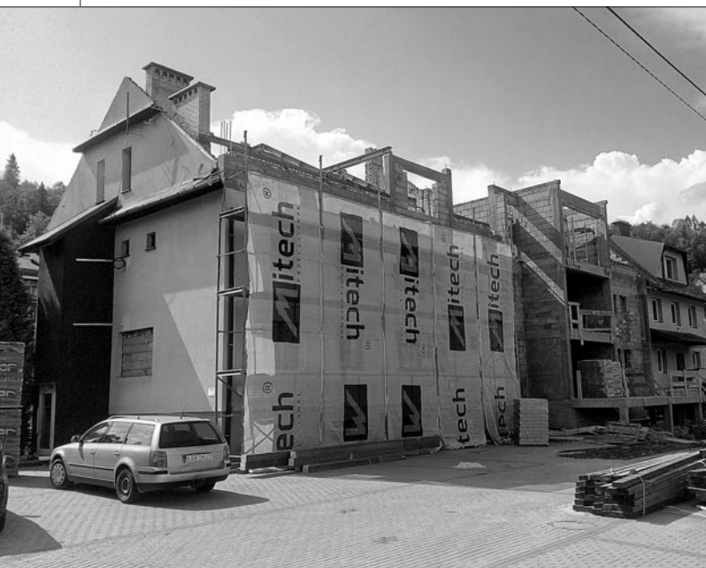
Budowa ośrodka zdrowia i Środowiskowego Domu Samopomocy w Mszanie Górnej