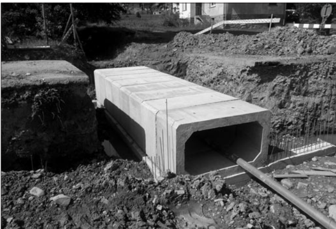
Remont przepustu w ciągu drogi Gęsia Szyja w Glisnem