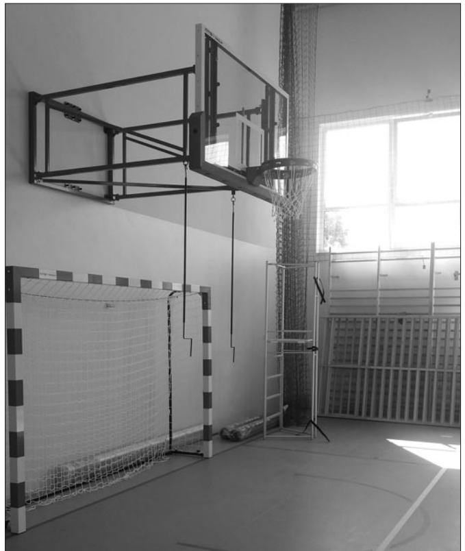
Sala gimnastyczna przy szkole nr 2 w Mszanie Górnej

piękną, wyposażoną już w biurka komputerowe salę informacyjną dla potrzeb młodzieży szkolnej.