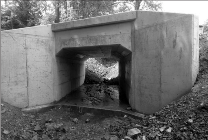
Przepust w ciągu drogi do os. Gacki w Olszówce