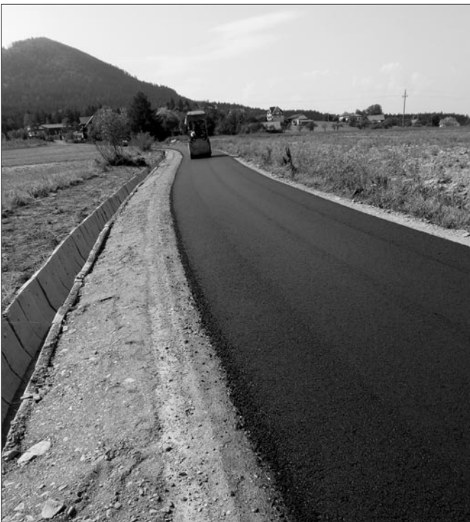
Droga gminna Kasina Wielka Pańskie Krzykacze