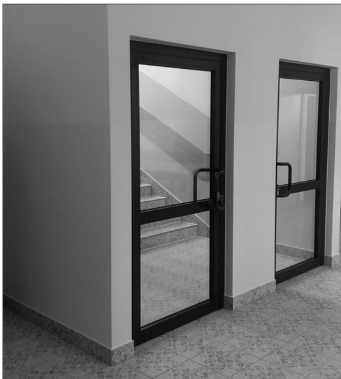
Przedszkole przy szkole nr 1 w Mszanie Górnej

Na finiszu jest modernizacja ogólnodostępnego boiska sportowego przy ZPO w Kasinie Wielkiej – budynek B, na które otrzymaliśmy dofinansowanie z budżetu Województwa Małopolskiego w wysokości 168 000,00 zł, w ramach projektu pn. „Małopolska infrastruktura rekreacyjno – sportowa MIRS”.