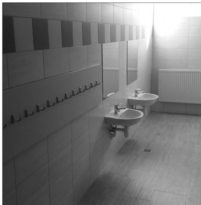
Przedszkole przy szkole nr 1 w Mszanie Górnej

Referat Inwestycji i Zamówień Publicznych