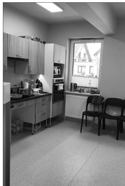
Pomieszczenie do zajęć kuchennych

pracownia krawiecka, pracownia komputerowa, gabinet psychologa/ pokój wyciszeń, sala do zajęć biofeedback, sala do zajęć/ treningów praktycznych. Sale są nowoczesnie wyposażone (kolumna wodna, podłoga interaktywna, monitor interaktywny), a także przystosowane do osób z niepełnosprawnościami ruchowymi. Podczas zajęć nasi Uczestnicy uczą się i doskonalą wykonywanie czynności dnia codziennego jak np. gotowanie, pranie, sprzątanie czy prasowanie. Prowadzone są zajęcia integracyjne, ćwiczenia usprawniające, zajęcia komputerowe, treningi komunikacji, arteterapia, spotkania i ćwiczenia z psychologiem (indywidualne i grupowe). Zajęcia są dostosowywane do możliwości i potrzeb uczestników. Obecnie do Środowiskowego Domu Samopomocy zostało skierowanych 32 Uczestników, kolejnych czterech dojdzie od stycznia. Pozostały jedynie 4 wolne miejsca. W naszym Domu panuje rodzinna atmosfera, ale nie zapominamy o profesjonalnym wsparciu naszych Uczestników.