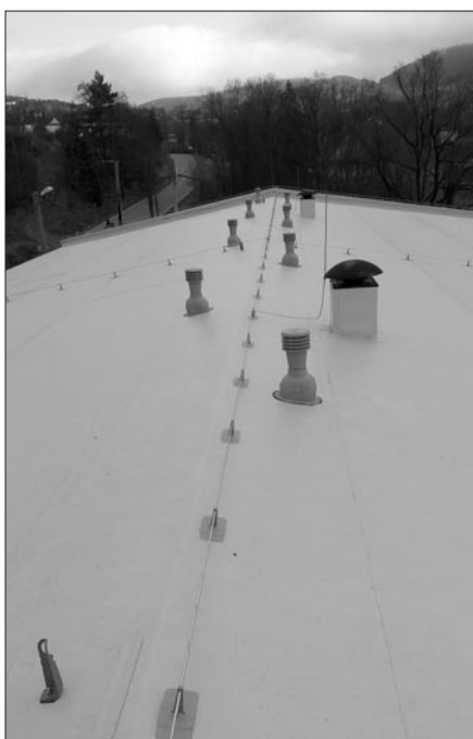
Wyremontowany dach sali gimnastycznej w Łętowiec

Mieszkańcy Raby Niżnej mogą się cieszyć zmodernizowaną drogą do osiedla Janówka. Wartość inwestycji zamknięta się w kwocie 333 330,62 zł, droga