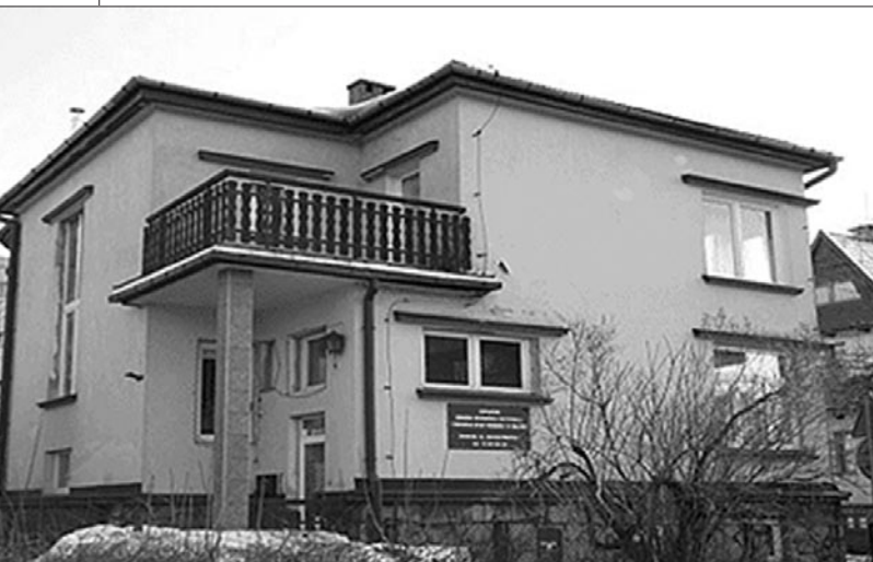
Tatrzanski Ośrodek Interwencji Kryzysowej i Wsparcia Ofiar Przemocy w Rodzinie

Nie ma sytuacji bez wyjścia. Każdy może sięgnąć po pomoc!