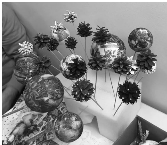
Ozdoby świąteczne wykonane przez uczestników ŚDS