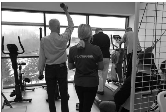
Zajęcia z fizjoterapeutą