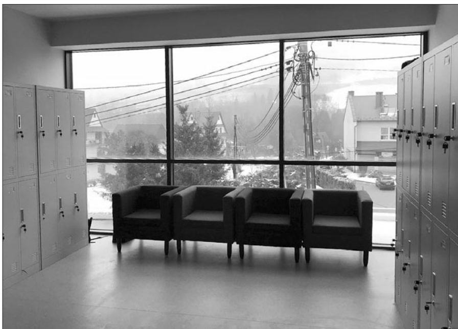
Szatnia dla uczestników Środowiskowego Domu Samopomocy w Mszanie Górnej