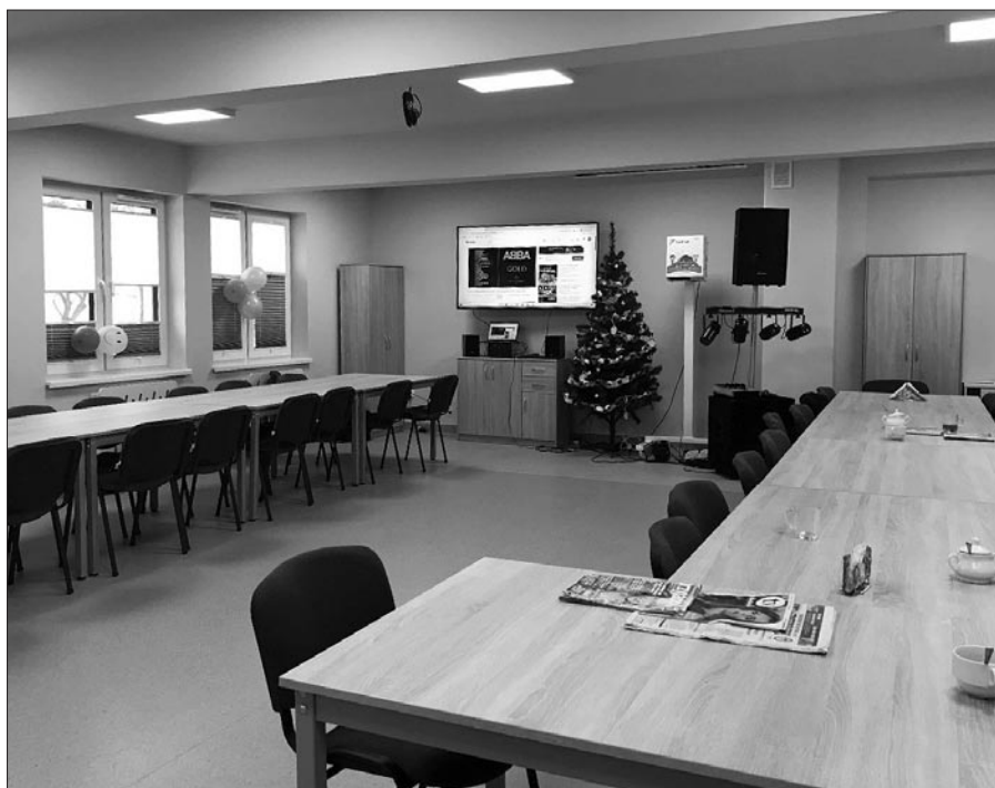
Świetlica w Środowiskowym Domu Samopomocy w Mszanie Górnej

w całości została wyremontowana ze środków własnych gminy.