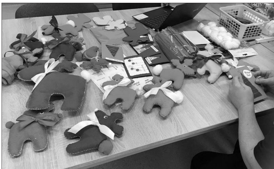
Pracownia krawiecka i rękodzieła