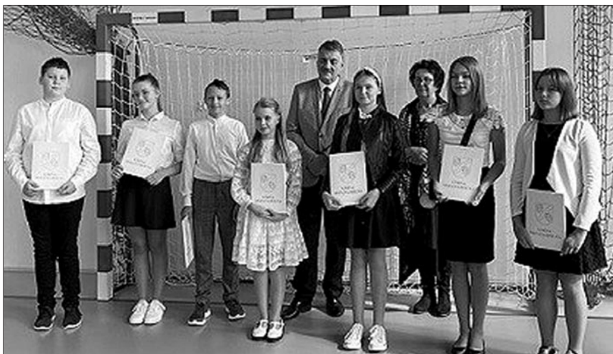
Stypendyści z Zespołu Szkoły i Przedszkola nr 2 w Mszanie Górnej