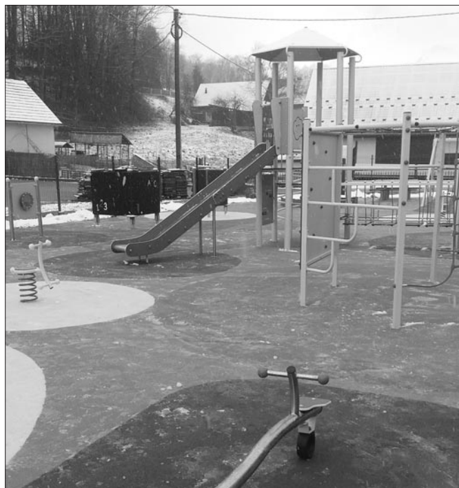
Nowy plac zabaw w Kasince Małej

z Rządowego Funduszu Inwestycji Lokalnych w kwocie 224 000,00 zł, pozostałe środki pochodziły z funduszy własnych Gminy Mszana Dolna.