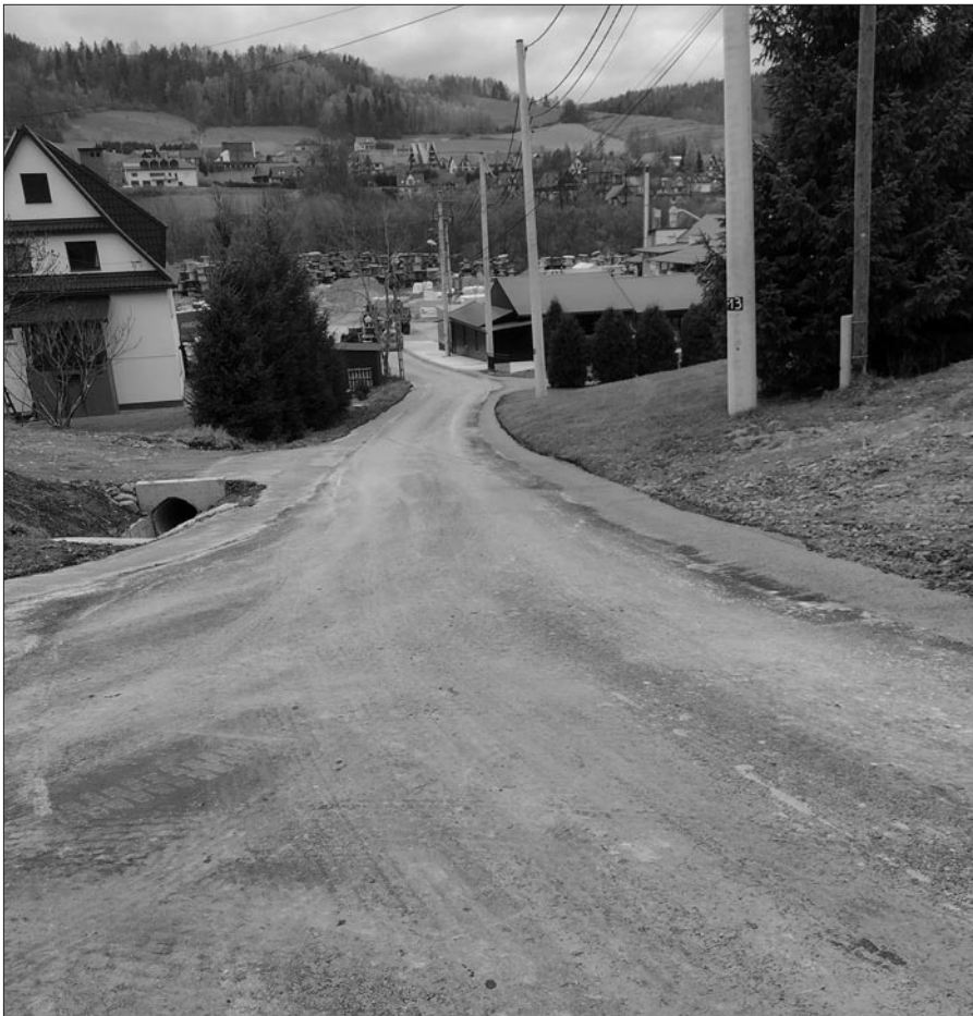
Zmodernizowana droga na osiedlu Janówka w Rabie Niżnej